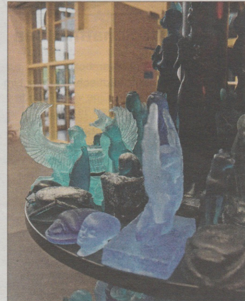
Rechts: Figuren aus Seife von Marlies Pekarek.

Am Ende raucht der Kopf. Die Ausstellung «12 x seriell» ist abwechslungsreich, enthält leichte Motive zum Schmunzeln, aber auch sehr intensiven Stoff, der die Gehirnzellen herausfordert.